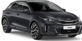
Fırtına Gri (H8G)