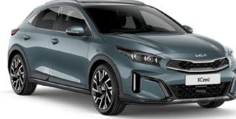
Yuka Gri (USG)