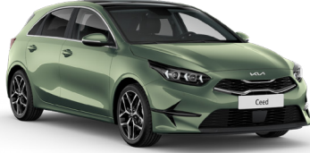
Experience Yeşil (EXG)