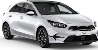
İnci Beyaz (HW2)