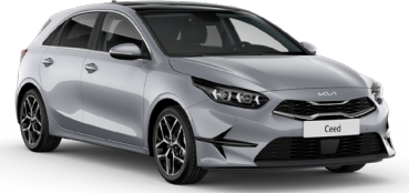
Gümüş Gri (KCS)