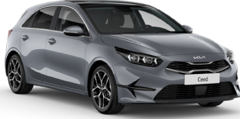
Aytaşı Gri (CSS)