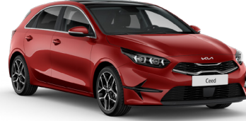
Manyetik Kırmızı (AA9)