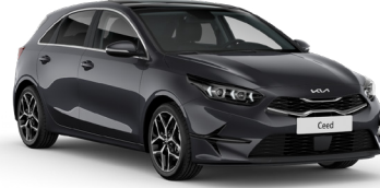
Fırtına Gri (H8G)