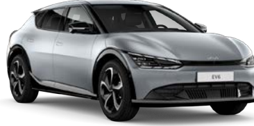
Moonscape Gri (KLM)