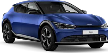
Yacht Mavi (DU3)