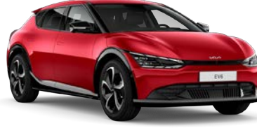
Runway Kırmızı (CR5)