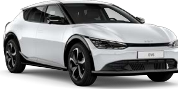
Snow Pearl Beyaz (SWP)