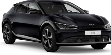
Aurora Pearl Siyah (ABP)