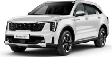
İnci Beyaz (SWP)