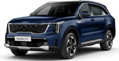
Gravity Mavi (B4U)