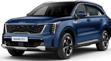
Mineral Mavi (M4B)