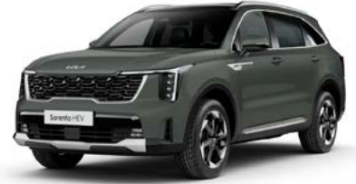
Cityscape Yeşil (CGE)