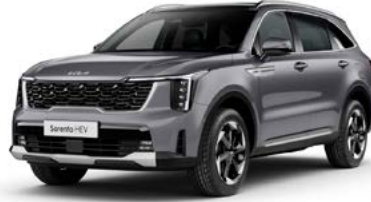
Metal Gri (KLG)