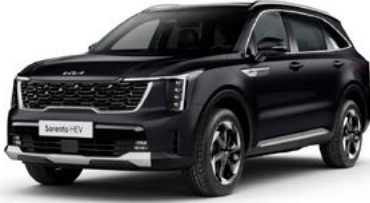
İnci Siyah (ABP)