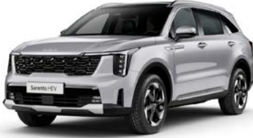
Saten Gri (4SS)