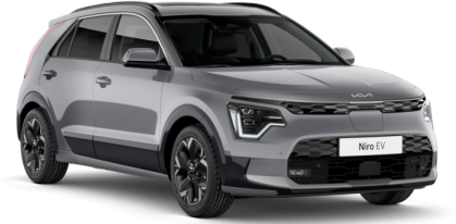
Steel Gri (KLG)