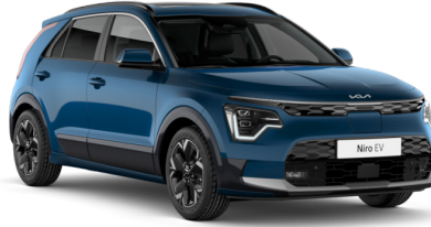
Mineral Mavi (M4B)