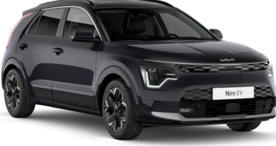
Aurora Pearl Siyah (ABP)