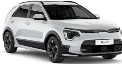
Snow Pearl Beyaz (SWP)