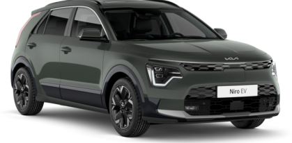
Cityscape Yeşili (CGE)