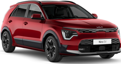
Runway Kırmızı (CR5)