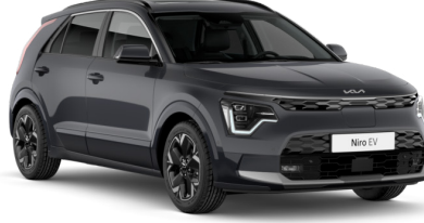
Interstellar Gri (AGT)